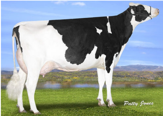
OCD DELTA MISSY DAM